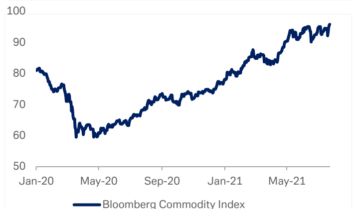
Gráfico 2: Índice Bloomberg de MM.PP.