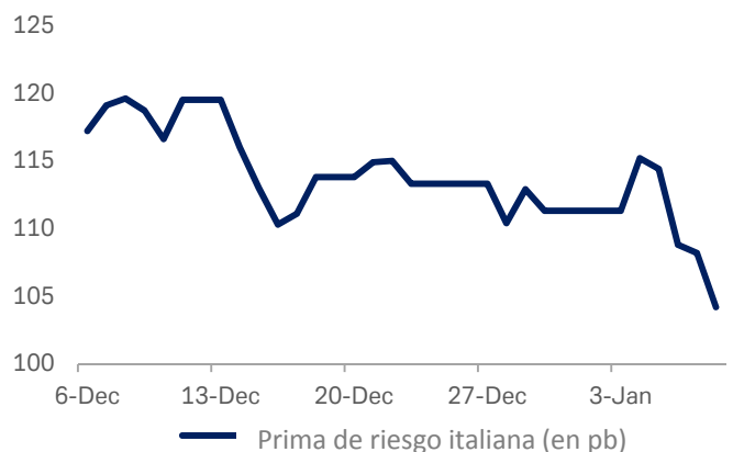
Gráfico 1: Diferenciales del bono italiano a 10 años respecto del Bund

8 de enero 2021