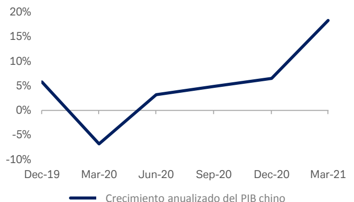
Gráfico 2: Crecimiento anualizado del PIB chino