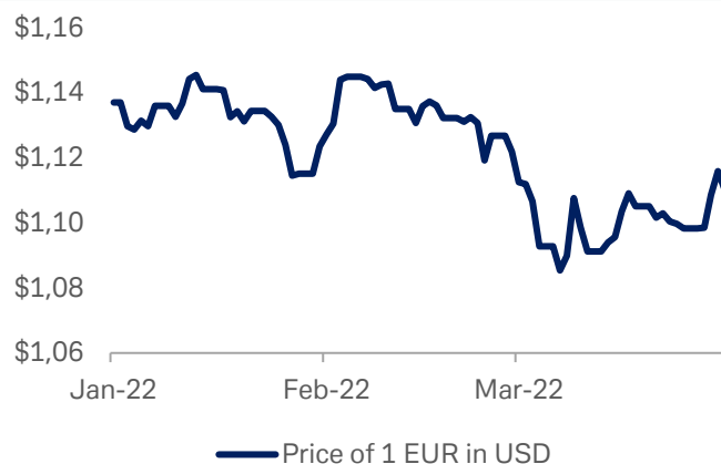
Gráfico 1: Tipo de cambio EUR/USD

Fuente: Bloomberg Finance L.P., Deutsche Bank AG. 1 de abril de 2022