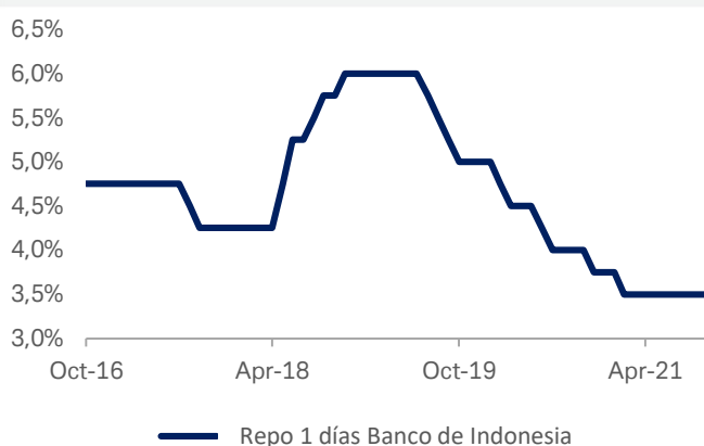
Gráfico 2: Tipo repo a 7 días de Indonesia